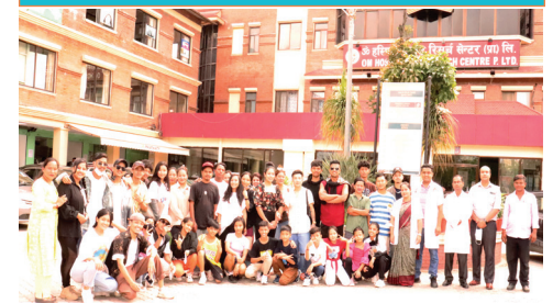
SUPER DANCER NEPAL PARTICIPANTS AT OMHRC