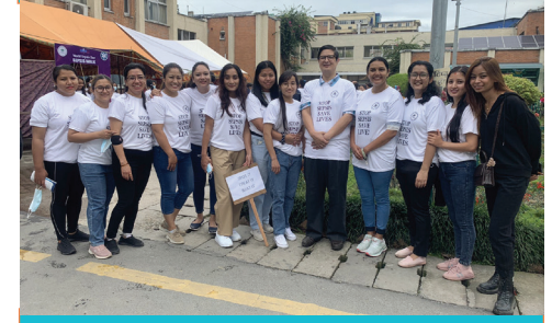
OMHRC ICU STAFF IN NCCDF INTER ICU SEPSIS QUIZ 2022