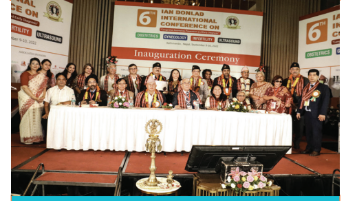
IAN DONALD INTERNATIONAL CONFERENCE 2022