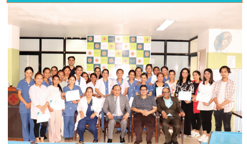
WORKSHOP ON INFECTION PREVENTION & CONTROL