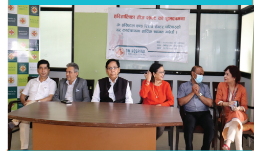
TEJ SPECIAL PROGRAM AT OMHRC